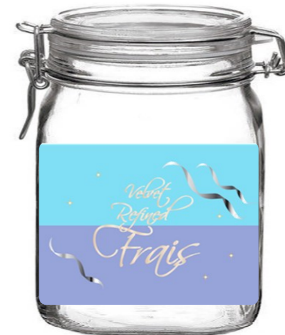
ベルベット リファインド フレ